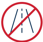
ACCESSO ALLE STRADE