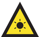
ONDATA DI CALDO